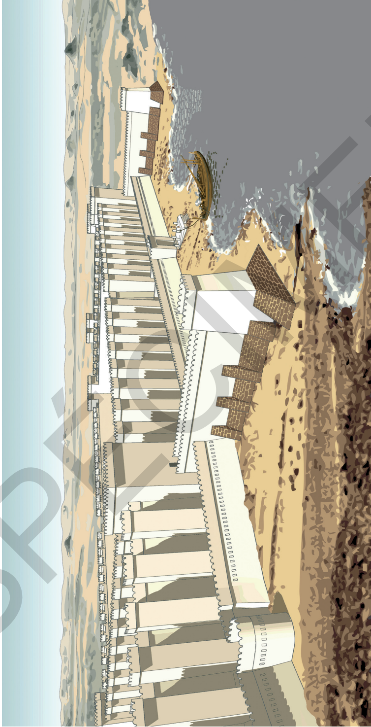
Planche XVI. Reconstitution de la forteresse d'Aniba (dessin de l'auteur).