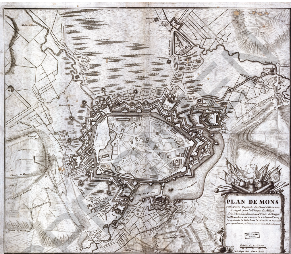
Fig. 44. Plan de Mons, ville forte, capitale du comté d'Hainaut, assiégée par les troupes des Alliez sous le commandement du prince d'Orange. La tranchée a été ouverte le 25 septembre 1709 ; le 20 octobre, la ville battit la chamade et se rendit par capitulation et l'ennemi en sortit le 23 du même mois. À La Haye, chez Anna Beek. - Don de M. César Plumet, ingénieur civil, à Mons (AÉM, Cartes et plans, n°1502)