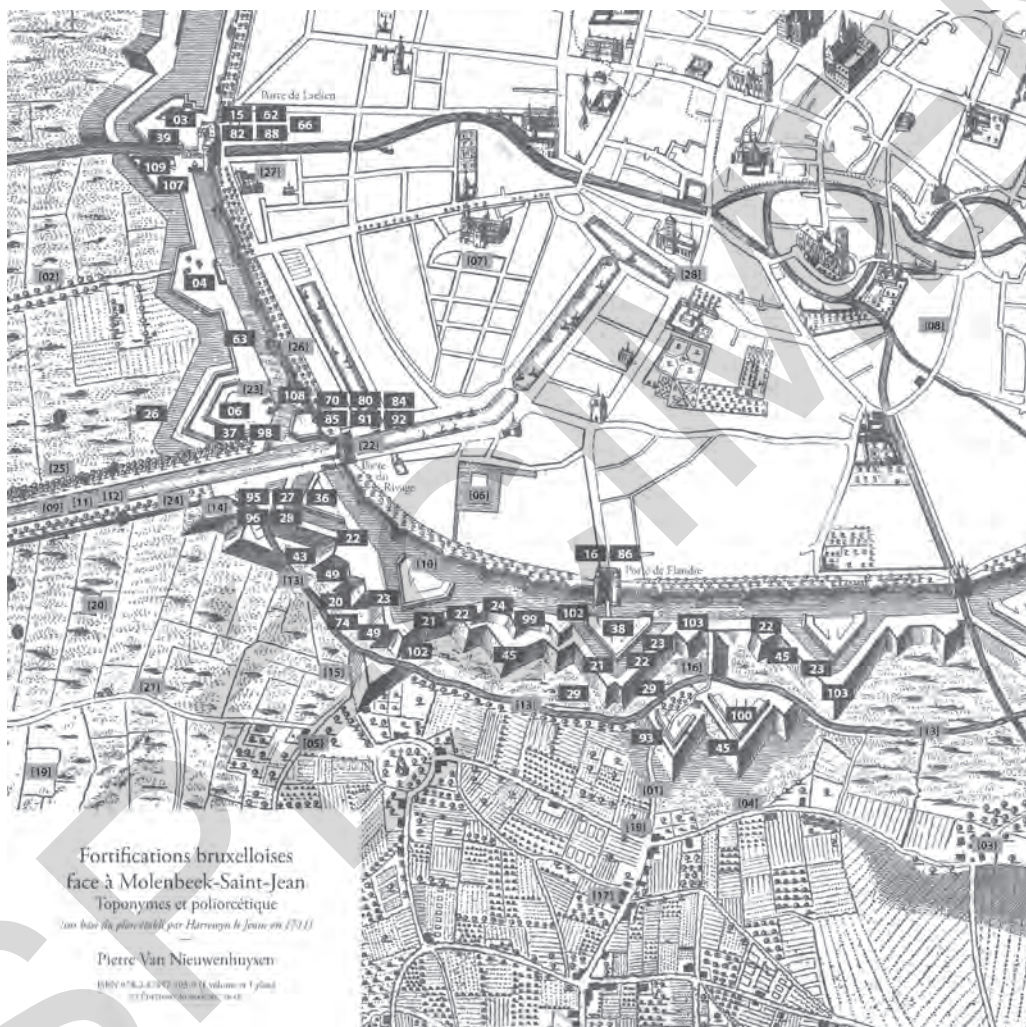
FIGURE 2. Reproduction du plan en couleurs annexé à cet ouvrage, montrant les fortifications bruxelloises face à Molenbeek-Saint-Jean