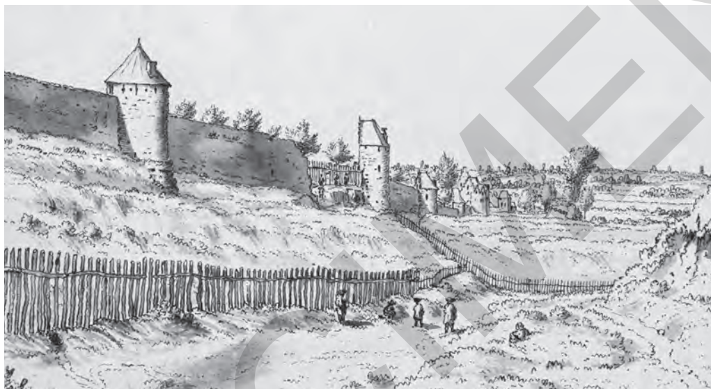
FIGURE 9. Palissade à l'extérieur de l'enceinte de Bruxelles Josua de Graaf, 1674

bruxelloises. L'appellation BOULEVARD s'appliqua alors à un dépôt probablement nouvellement construit.