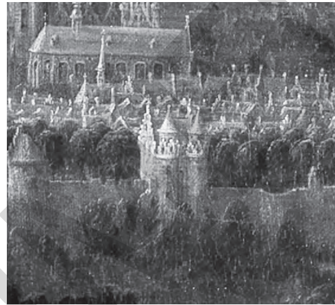
FIGURE 15. La Porte de Flandre (n° 86) et ses deux tourelles Th. Van Heil, 1692

tot meule beck den prins kordinael... AEB, AE 1855. » 1671 la porte de flandres AGR, C&P i.m. (505) 1157/2. » ± 1673 Porte de flandre AGR, C&P i.m. (505) 1157/11. » XVIII e s. Porte flamins Flam(m)ische Porten VAN RIE-1978-50-51. » 1708 Porta Flandrica Flandrische Thor AGR, C&P i.m. (505) 853. » 1838... hors la porte de flandre au Chemin des moutons... CM, AB40-42. ♦ LOC. ET EXPL. Faisait partie de la deuxième enceinte de la ville de Bruxelles, se trouvait à la fin de la rue de Flandre bruxelloise et était le point de départ de la chaussée/ route de Gand/ Flandre , d'où son nom (voir VAN NIEUWENHUYZE-2008-98 et 339). ♦ Div. Terminée le 06 mai 1373 (JACOBS-2004-77). La PORTE DE FLANDRE était protégée par trois tourelles auxiliaires : les Tours des Bateliers, des Graissiers et d'Olivier Vander Noot (H&WIV, 218 / DUBREUCQ-3-276). Ces tours purent servir à abriter les chiens de chasse de l'archiduc Albert (°1559, 1598-1621). Selon H&WIV-216, la PORTE DE FLANDRE fut abattue en 1783, tandis que DUBREUCQ-3-282 indique qu'on la mit à bas en 1784 ♦ VOIR MOLENBEEKPOORT.