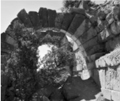
PHOTO 36. Arc à claveau (tranche de voûte). Cyrrhus, Nebi Yunnus, Syrie

CLAVEAU (n.m.) Élément (pierre) d'un arc taillé de manière à ce que les *faces latérales (supérieure et inférieure) soient inclinées et que leurs *arêtes se rejoignent au *centre de la courbure (on dit que ses faces sont placées dans des plans *rayonnants à partir du centre de *l'ouverture (fig. 12). La rigidité de l'arc est assurée par leur forme même qui empêche tout glissement des blocs les uns par rapport aux autres. Contrairement au *sommier les plans supérieur et inférieur d'un cla-