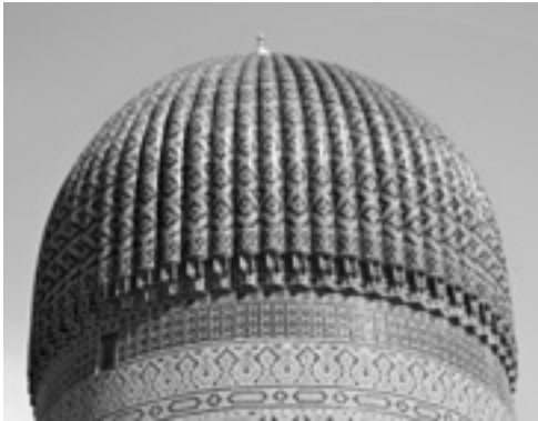
PHOTO 45. Dôme à surface plissée ou à côtes. Gur Emir, Samarkand, Ouzbékistan

DÔME (n.m.) À SURFACE PLISSÉE ou À CÔTES Dôme dont la surface extérieure porte des nervures convexes, ou côtes, séparées les unes des autres ou accolées.