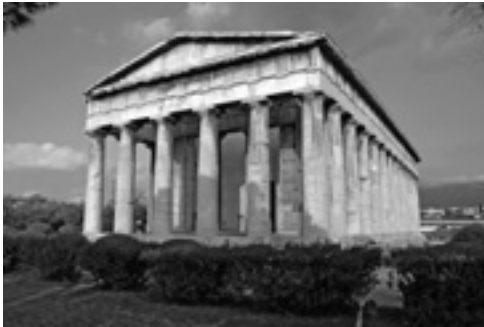
PHOTO 57. Temple péripète. V e siècle avant J.-C. Temple d'Héphaïstos, Agora d'Athènes, Grèce

On appelle *péristyle la colonnade qui entoure entièrement ou partiellement le temple.